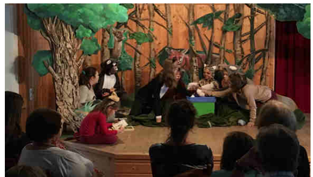
Die „Tiere“ plündern die Kühlbox der „Menschen“