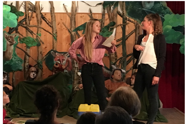
Bauunternehmerin und Architektin streiten über die Planänderung

(ace) Es waren am 22.07. viele Besucher gekommen, um das Stück „Der Bär ist los“ zu sehen, das die Initiatorin Almut Carsten-Elsässer für ihr Ensemble geschrieben hatte und bei der Begrüßung kurz umriss: Eine Bauunternehmerin und eine Architektin wollen einen Kiosk für Wanderer im Wald bauen und haben dabei tierischen Ärger.